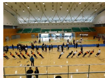
綱引き大会の様子