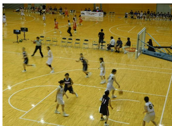
天皇杯皇后杯バスケットボール選手権

9月14日(土)は「新日本プロレス」が開催されます 一年ぶりの開催、とっても楽しみです